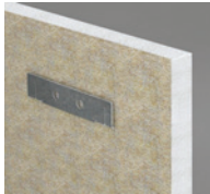
Акусто Элемент крепление на двойной крепежный крюк.