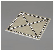
Акусто Элемент крепление на клей-герметик.